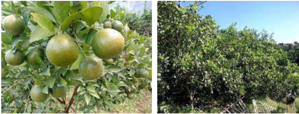
Gambar 2: Spot Kebun Jeruk