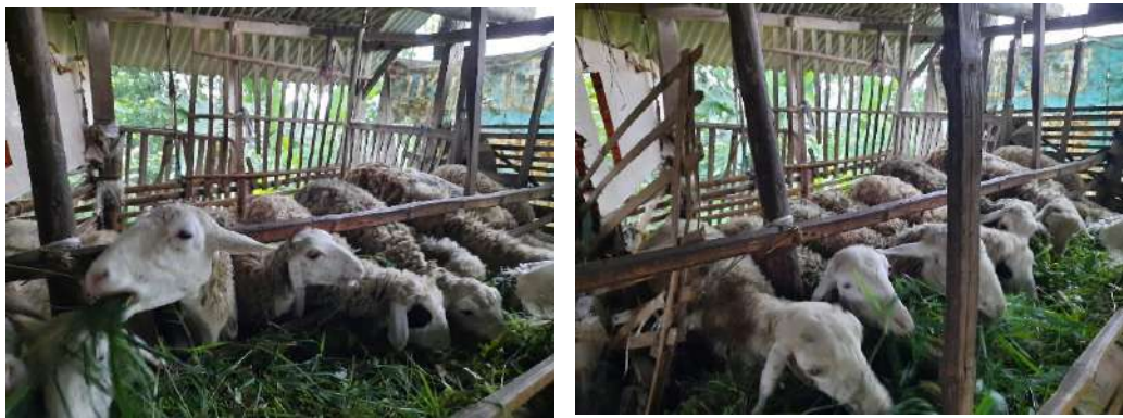
Gambar 6: Potensi Budidaya Domba