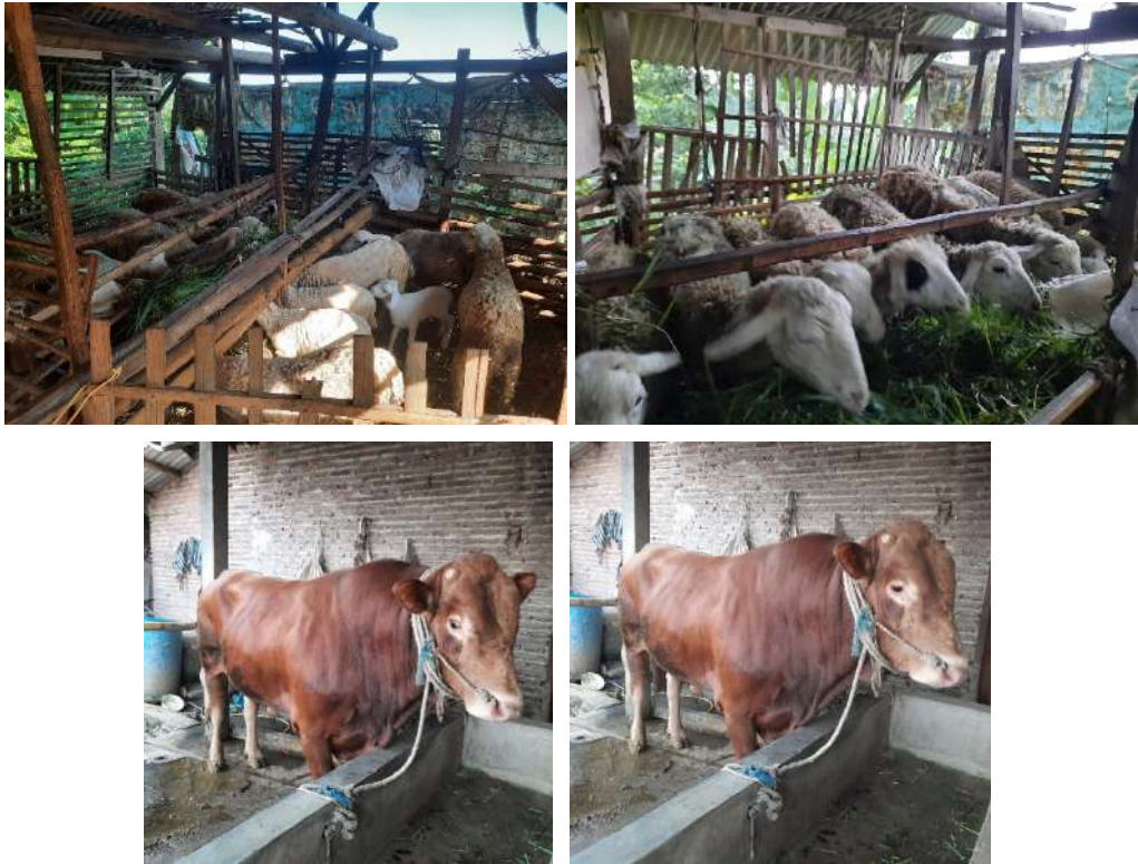
Gambar 7. Peternakan kambing dan Sapi