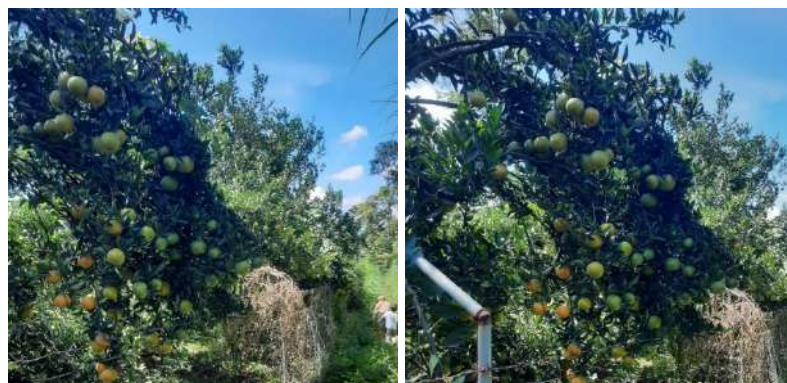
Gambar 7: Kebun Jeruk

Potensi wisata di desa petungsewu meliputi, hasil perkebunan jeruk, peternakan, sumber air yang melimpah, rest area, tempat makan dan cafe, sekolah bertaraf nasional dan internasional. Lahan pertanian dan perkebunan yang luas dan pengeloanya masih bisa diotimalkan. Desa Petungsewu sangat baik untuk pengembangan peternakan sapi, kamping, ayam dan ternak lainnya. Melimpahnya sisa kotoran hewan ternak yang bisa dibuat pupuk organik. Potensi ini dapat dikembangkan sehingga dapat meningkatkan kesejahteraan masyarakat (Zakaria & Dewi, Suprihardjo, 2014)