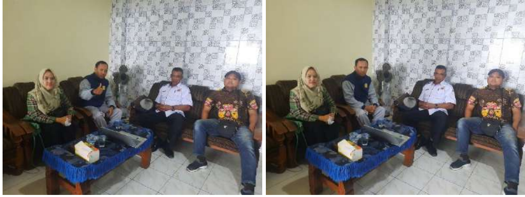
Gambar 1. Sosialisasi program pemetaan potensi wisata bersama kepala desa petungsewu