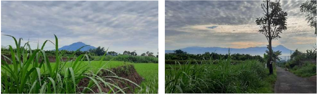
Gambar 5: Panorama Alam Desa Petungsewu