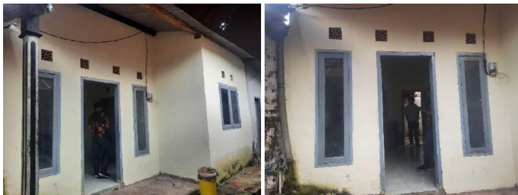
Gambar 12: Rintisan Rumah Produksi Olahan Jeruk.