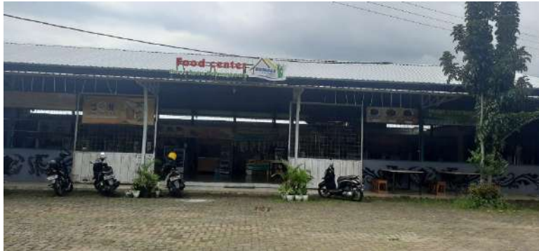
Gambar 9: Rest Area