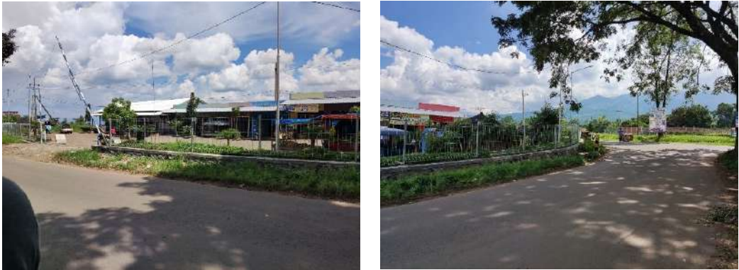
Gambar 3: Rest Area