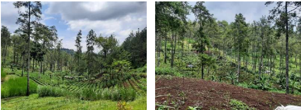
Gambar 4: Hutan Lahan yang Dimanfaatkan Masyarakat Petani Jeruk