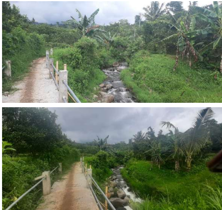
Gambar 8. Sumber Air