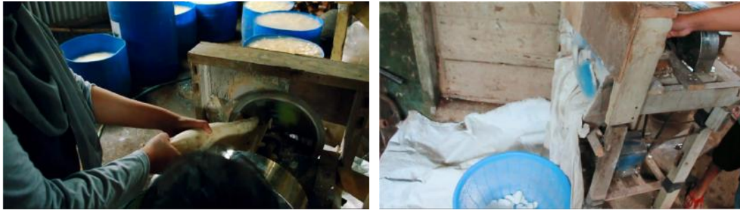
Gambar 7. Proses Pemotongan Singkong dengan Mesin