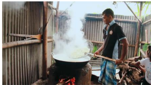
Gambar 8. Proses Memasak Potongan Singkong