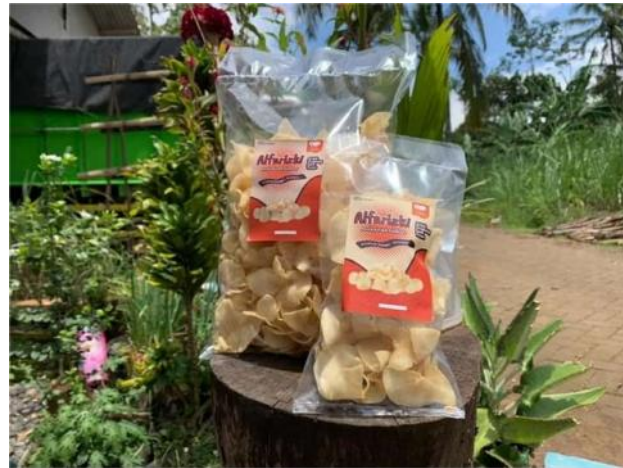
Gambar 2. Pengemasan Produk

Sebelumnya, Mitra tidak memiliki nama brand dan juga hanya menjual keripik singkong setelah jadi. Setelah dilakukan pendampingan terciptalah nama KERIPIK SINGKONG ALFARIZKI sebagai nama brand . Kemudian dibuatlah desain logo, stiker, dan kemasan sebagai branding dari Keripik Singkong Alfarizki. Pada Gambar 2 disajikan pengemasan untuk Keripik Singkong Alfarizki.