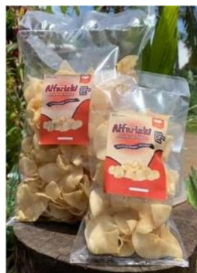
Gambar 10. Foto Produk dengan Kemasan Baru