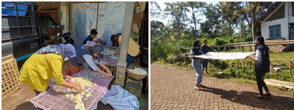
Gambar 9. Proses Penjemuran Potongan Singkong