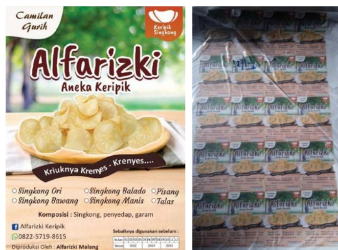
Gambar 3. Pembekalan Logo dan Stiker Siap Pakai untuk Mitra

Dalam perkembangannya, Keripik Singkong Alfarizki mengutarakan harapannya untuk bisa memperluas produksinya tidak hanya keripik singkong saja, tetapi juga di masa mendatang ingin memproduksi keripik pisang dan keripik talas sebagai produk sampingan. Oleh karena itu dibuat desain logo dan stiker baru untuk dapat mengakomodir kebutuhan promosi produk sampingan tersebut, seperti disajikan pada Gambar 3.