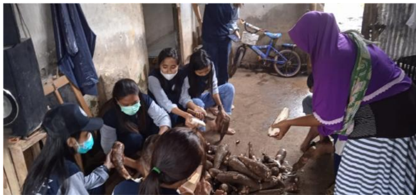
Gambar 6. Proses Penyortiran dan Pengupasan Singkong

Dalam kegiatan pengabdian kepada masyarakat sekaligus KKN ini, mahasiswa juga turut terjun langsung untuk membantu proses produksi keripik. Dimulai dari proses penyortiran dan pengupasan singkong (Gambar 6), proses pemotongan singkong dengan mesin (Gambar 7), dan proses penjemuran potongan singkong (Gambar 9). Hal ini memberikan pengalaman positif bagi mahasiswa karena dapat belajar langsung dari pemilik usaha dan menumbuhkan jiwa entrepreneur . Pada Gambar 10 disajikan foto produk dengan kemasan baru yang digunakan sebagai konten promosi di sosial media.