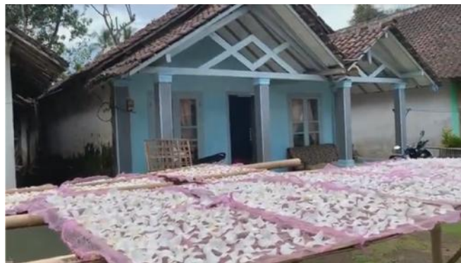
Gambar 1. Contoh Produk Keripik Singkong Setengah Jadi

Desa Sukopuro merupakan salah satu desa yang berada di wilayah Kecamatan Jabung, Kabupaten Malang. Mayoritas lahan yang berada di wilayah Desa Sukopuro adalah berupa lahan kosong dan lahan olahan. Hasil bumi yang menjadi keunggulan desa adalah tanaman tebu dan juga singkong. Sehingga terdapat beberapa orang yang memanfaatkan hal tersebut untuk membuka usaha pembuatan keripik singkong, salah satunya usaha keripik singkong milik Bu Nur yang menjalankan usaha mandiri ini dengan modal dan sistem seadanya. Usaha pembuatan keripik ini dijalani oleh Bu Nur bersama dengan suami di sela-sela waktu bekerja sang suami dan juga waktu Bu Nur mengurus anak-anaknya. Dalam prosesnya Bu Nur dibantu oleh beberapa orang tetangga untuk memotong dan menjemur potongan singkong tersebut. Produk usaha Bu Nur selama ini berfokus hanya pada penjualan keripik singkong setengah jadi yang dijual dalam satuan bal/glangsi. Potensi yang dimiliki oleh usaha ini cukup besar, yaitu dalam sekali produksi dapat mengeksekusi \pm 300 kilogram singkong segar dan dapat terjual habis dalam kurun waktu kurang dari 1 (satu) minggu.